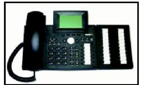
VoIP συσκευή 360 Snom Γερμανίας

Η κορυφαία επαγγελματική συσκευή VoIP, εξοπλισμένη με όλες τις διαθέσιμες δυνατότητες. Ιδανική για κεντρική συσκευή. Είναι σχεδιασμένη για μέγιστη παραγωγικότητα, για απαιτητικές μεσαίες - μεγάλες επιχειρήσεις/Call Centers.