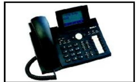
VoIP συσκευή 320 Snom Γερμανίας