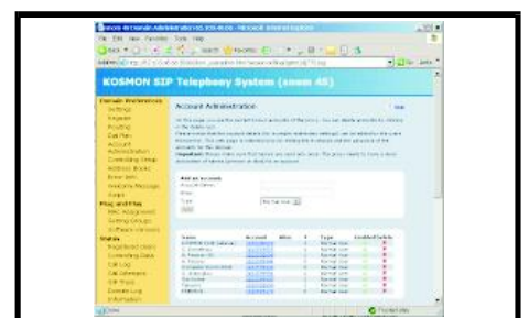
Λογισμικό Snom-KOSMON PBX/ACD