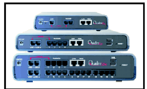
VoIP SIP - PSTN gateways